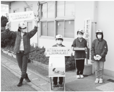
10/24 FOS 少年団街頭募金の様子