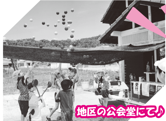
地区の公会堂にて♪

ごどもひろばの開催・移動遊び場「プレーカー」の運行等に関するお問い合わせは「チラシ」 ☎086912212682 定期的開催もしておりますので、興味のある方はぜひお問合せ下さい。見学だけの方も大歓迎です!