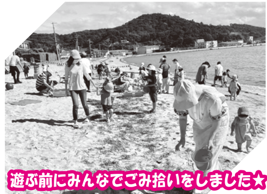
遊ぶ前にみんなでごみ拾いをしました☆