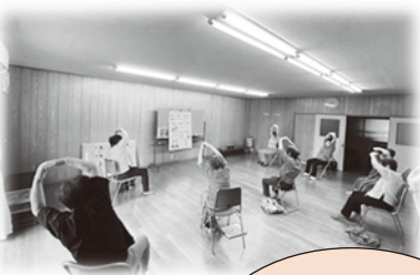
八丁ほつらつ教室