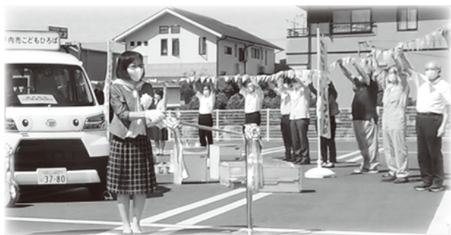
移動遊び場「プレーカー」の出発式で活用

ホームページや口コミで広くPRしたこともあり、市内在中・在学の中学・高校生や大学生以外にも、社会人の方や県外の学生からも多くの作品を届けていただきました。この紙面を通じてお礼申し上げます。