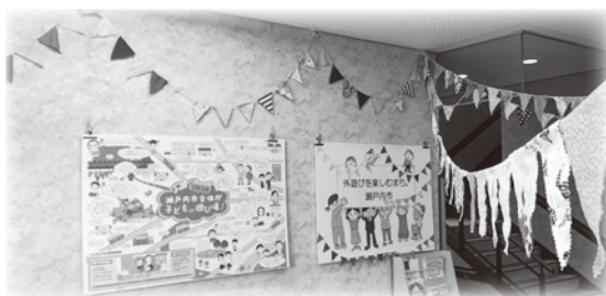
社協内のこどもひろばコーナーで活用中