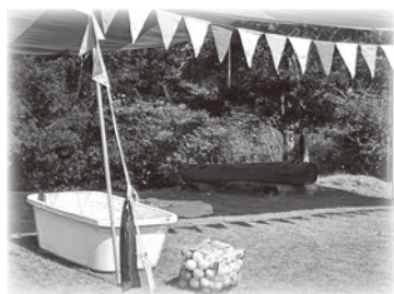
イベントで活用中