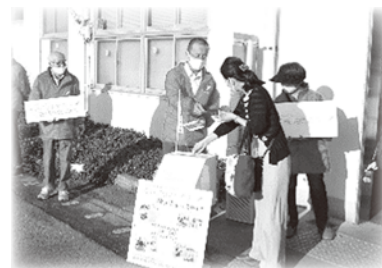
邑久駅での街頭募金