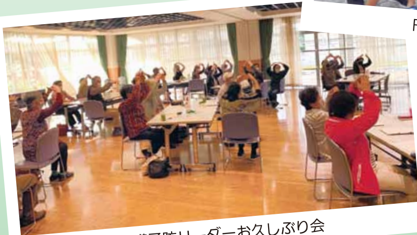
介護予防リーダーお久しぶり会