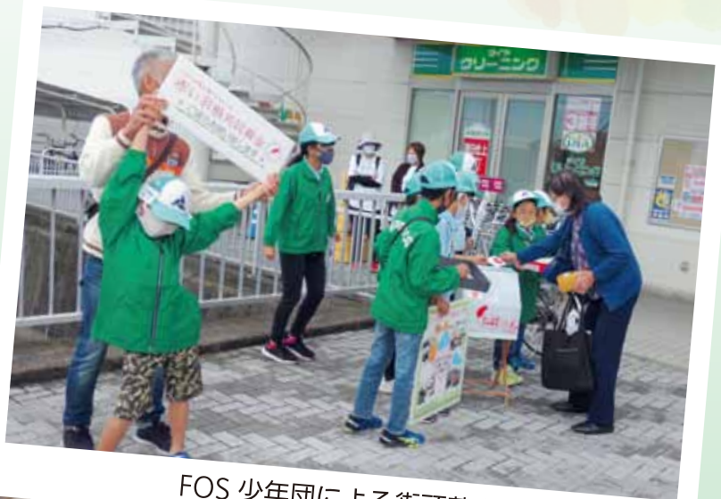
FOS 少年団による街頭募金