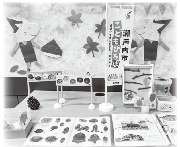
【 どんぐりを使った遊びが人気です 】

さて、今月号では本会福祉センターに設置した「瀬戸内市こどもひろば」のブースを紹介したいと思います。これまでの活動や実際に外遊びで使用しているものを展示していますので、近くに来られた際には、ぜひお立ち寄りください。市民のみなさんと外遊びについてお話したり、情報交換できたらと思います！