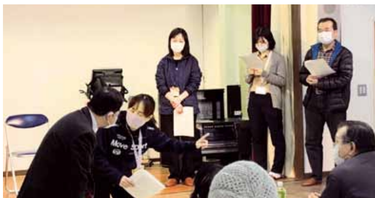
豊原地区小地域ケア会議の様子