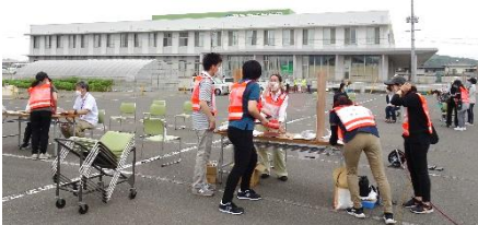
災害ボランティアセンター設置・運営訓練の様子