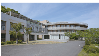
■ 牛窓地域 在宅介護支援センター AJISAI ☎ 0869-34-6368

ランチ事業所の紹介 ※ランチ事業所は地域包括支援センターの総合相談支援業務の協力機関(地域の窓口)です。