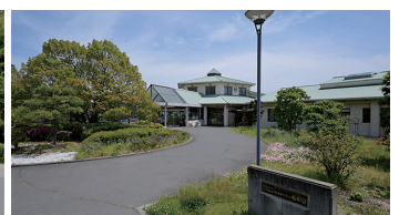
■ 長船地域 長船荘在宅介護支援センター ☎ 0869-26-4772