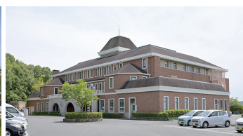
■ 邑久地域 (裳掛地区除く) 邑久在宅介護支援センター ☎ 0869-22-9503